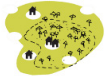
Nationale Landschappen - niet omheind, onderdeel van een streek - geen entree - cultuur en in mindere mate natuur - verblijven niet geïntegreerd - prototype: Stelling van Amsterdam