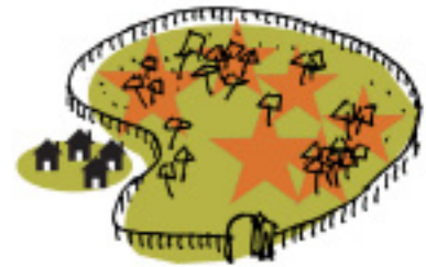
dierentuinen/ attractieparken - omheind - entree - natuur en cultuur - verblijfsvoorzieningen buiten het park - veel voorzieningen en parksetting, in evenwicht - prototypen: Burgers Bush (ook de Efteling en Duinrell!) (ca 1,5 milj bezoekers per jaar)