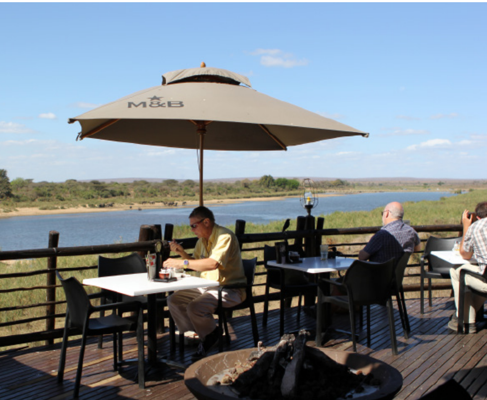
Lunch in Kruger National Park met zicht op een kudde olifanten en met bezoek van vogels.

enorme omvang nieuwe betekenissen te geven. Met het Groene Hart blijf je eindelijk aan het schuiven en rommelen. Het is een getouwtrek tussen 'rood en groen', tussen beleid van verschillende ministeries, waarbij rood (EZ) telkens wint en het landschap de grote verliezer is. Bij de Nieuwe Hollandse Waterlinie winnen landschap én economie.