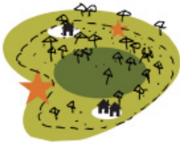
Nationale Parken - niet omheind - geen entree - natuur als kern, cultuur op tweede plaats - verblijven niet geïntegreerd, alleen kleinschalig - enkele voorzieningen/attracties veelal in de randen - prototype: Weerribben Wieden (ca 1-4 milj bezoekers/jaar (schatting 2004))