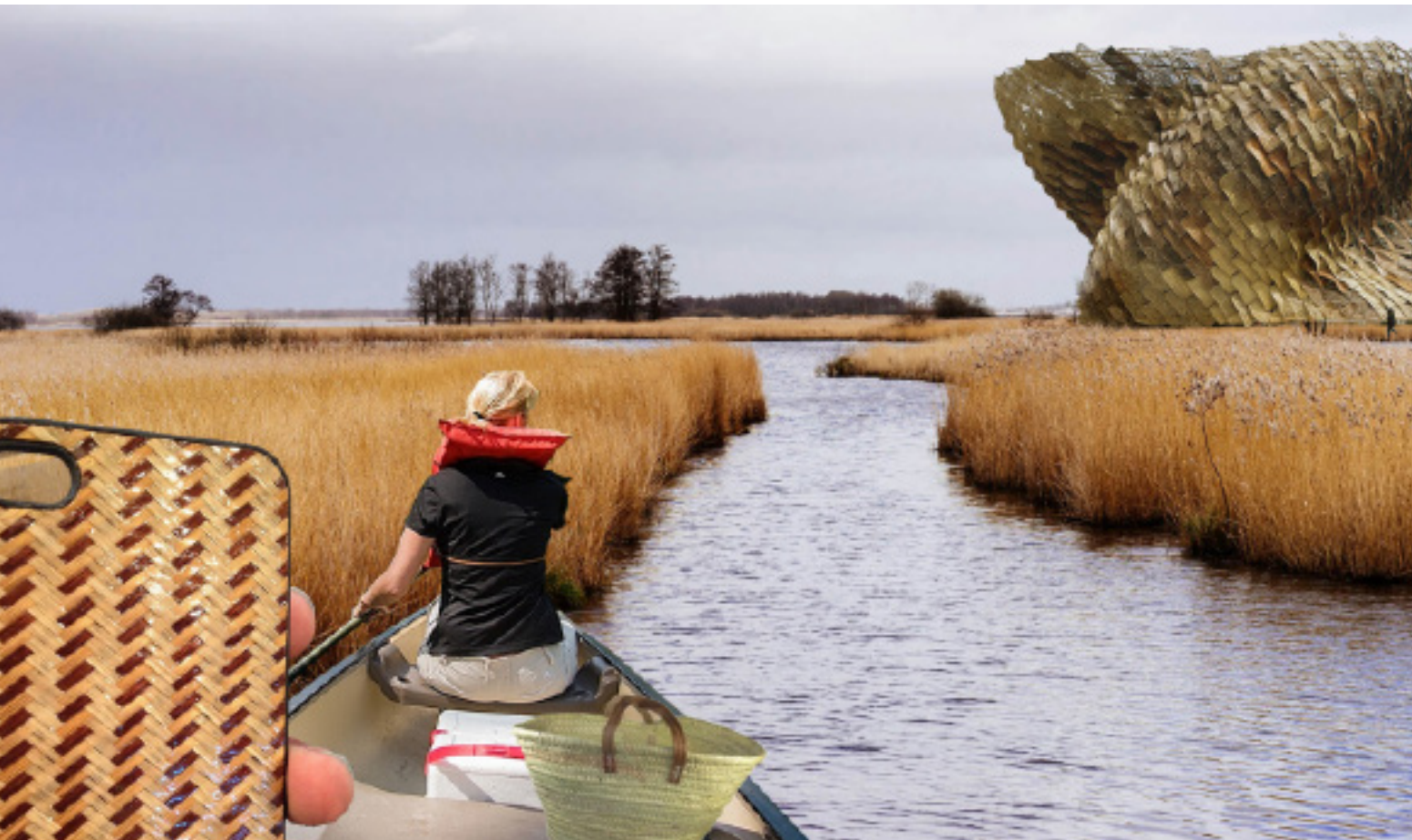
Fotocollage van een rietkenniscentrum in Nationaal Park Weerribben-Wieden; onderzoek, marketing en beleving versterken elkaar (impressie: Rob Aben Landschapsarchitectuur).

Sinds een paar maanden zijn enkele leden van de Tweede Kamer toch weer bezorgd geraakt en trekken ze zich het lot van de nationale parken aan; hebben sommige gebieden toch rijksbelang? Er zal nu nader worden onderzocht of er toch enkele nationale parken moeten worden aangewezen die een (inter)nationale betekenis hebben én rijksbescher-