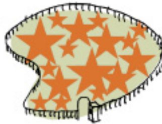
attractie-/pretparken - omheind - entree - nauwelijks natuur - veel voorzieningen, attracties - prototype: Slagharen (ca 1,4 milj bezoekers per jaar)