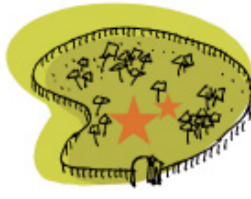
Nationaal Park exclusief - omheind - entree - nadruk ligt op natuur - geen verblijven - enkele voorzieningen/attracties: in het midden! - prototype: Park Hoge Veluwe (ca. 500.000 betalende bezoekers per jaar)