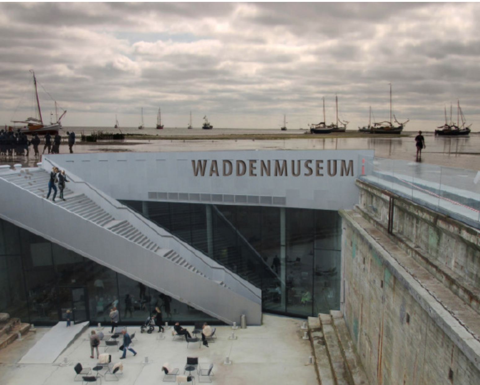
Fotocollage van een ondergronds Waddenmuseum in het wad. Ook geschikt voor overnachtingen (impressie: Rob Aben Landschapsarchitectuur).

passende beleidsstatus van dit grootste aaneengesloten natuurgebied in Nederland. In de praktijk blijkt dat, ondanks de vele beleidsdiscussies, het de mensen buiten in het veld zijn geweest die met een pragmatische instelling hebben gewerkt aan het behouden en ontwikkelen van een waardevolle en grootse natuur.