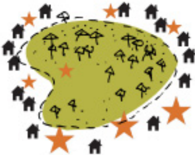
stadsparken - vaak omheind - geen entree, openbaar - verblijven (wonen) buiten het park - cultuur en natuur hand in hand - enkele voorzieningen in en veel buiten het park - prototype: Vondelpark (ca. 13 milj bezoekers/jaar)